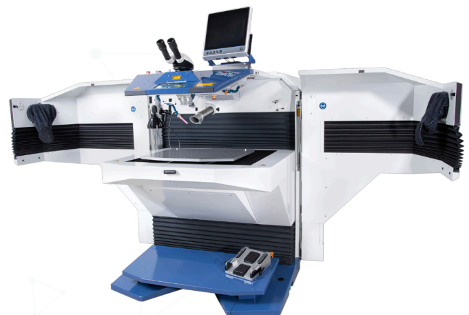
ALW 300 offen